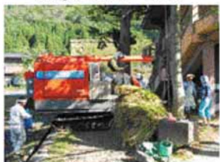
コンバインで脱穀 10月1日