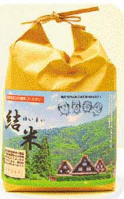
世界遺産コシヒカリ「結米」