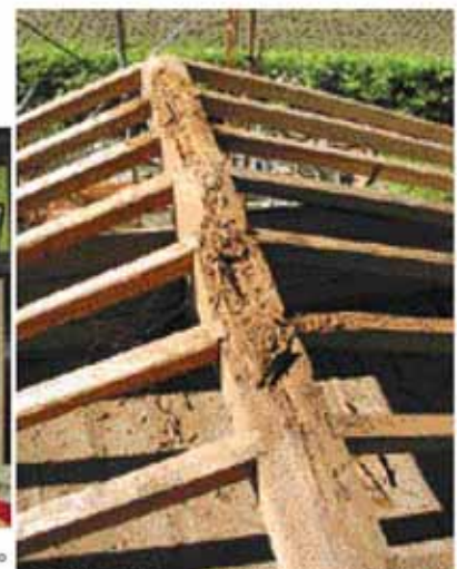
修理前：棟木の破損状況。破損部を取り除き矧木修理をした。