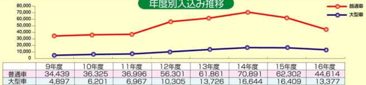
平成9年～16年度 せせらぎ公園小呂駐車場月別利用実績