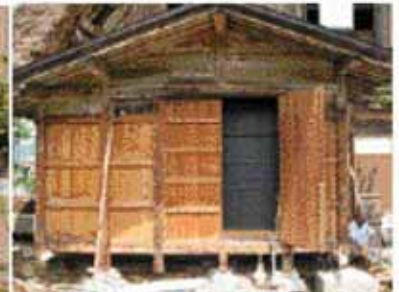
施工中：ササラ下見板壁を外すと仏間を運び出す開き戸が付いている。