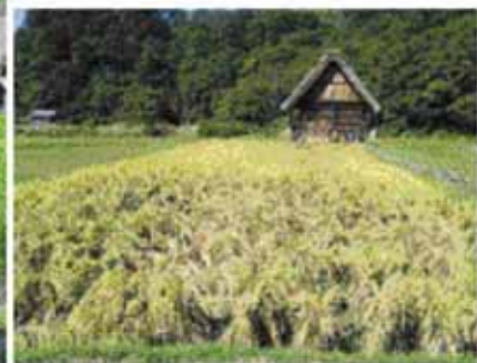
台風で倒された稲を束ねた 9月10日