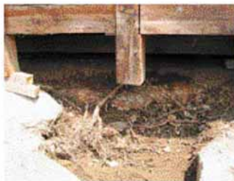
施工中：床下に松の根が這っている。この柱の礎石を外側に押し出していた。