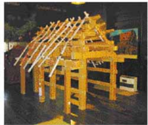
◀白川小の合掌造り