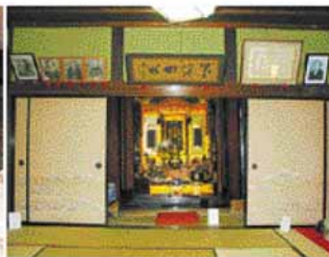
修理前：仏壇が傾いているのが目視で解る。