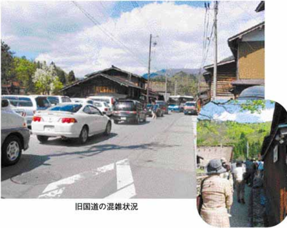
旧国道の混雑状況