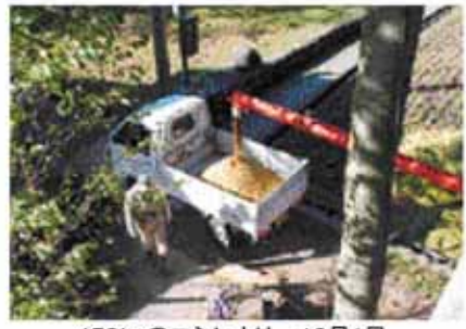
450kgのコシヒカリ 10月1日