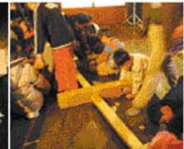
◀柱に貫を通します。